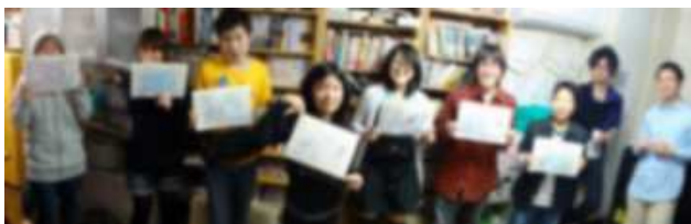
一人一人への手作り卒業証書と卒業卒業生全員での写真。

さて、去る 2012 年 3 月、みなもからは 5 人の卒業者が出ました。活動を始めて 7 年とちょっと。少しずつみなもを旅立ち、次の道を進みはじめた人達が増えてきました。もちろん、みなもにはいろんな子ども達が来て、いろんな旅立ち方があります。年度途中でみなもとして一定の役割を終え、フェードアウトしていく子どもも多い中、3 月末で明確に「卒業」として旅立つ子どもはほんの一握りですが、今回はそのほんの一握りの「卒業者」のメッセージと、卒業その後に触れてみたいと思います。