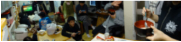
↑お泊り会中の1階の様子です

夜になって、みんなが寝たりしださないのに驚いたのは当たり前、夜中に、シフォンケーキを食べたことと、それから40分ほど経って3分間の軽い睡眠をとったら、それまでの40分間の記憶がすっかり飛んでしまったことまで覚えています。確か眠りについたのは4時40分くらいでしたでしょうか。目覚めたのは7時前でした。