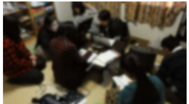
↑なにやら制作中の様子？

みなもで学んだことは今でも本当に貴重な体験で、落ち込んだときや、人付き合いに関しては特に重宝しています。また大阪に戻ったら顔出しますね。