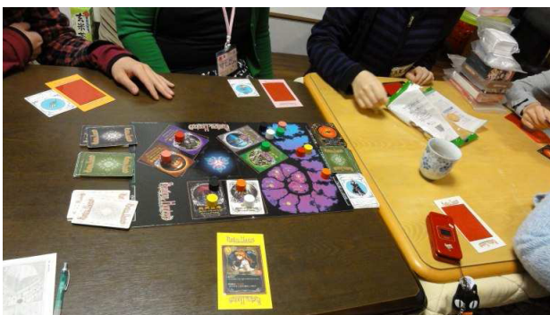
↑みなもで一番人気のある？『シャドウハンター』

基本的に、お泊り会では睡眠時間の短い私ですが、このときも3時間は眠れなかったんですね。やけに40分との縁がありますが気にしないで頂きたいところです。と、こうして初めてのお泊り会を振り返ってみるといつも思うのですが、いつも自分の話したことや他人の話したことは耳がちくわになったかのごとく頭から抜けていくというのに、こういう妙なことだけはちゃんと頭の中に残しておいてくれるんですね。