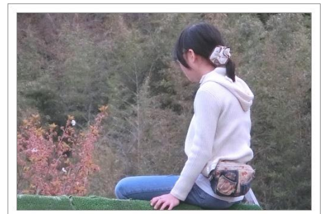
パンフレットにも使っている、彼女の最高の1枚！