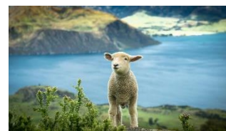
ニュージーランドで、元気にやっってるかな。

生徒に寄り添って、対応してくれることが、その当時の自分にとって、通いやすかったです。大学受験の相談も親身になって、先生方がサポートしてくださいました。