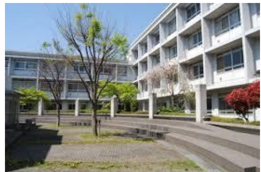
志望した高校での新生活、楽しんで！