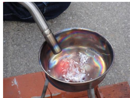
フリースクール時代、様々な実験などに興味を持って取り組んでいました。